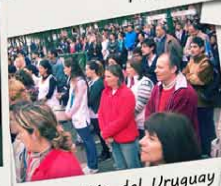
Concepción del Uruguay